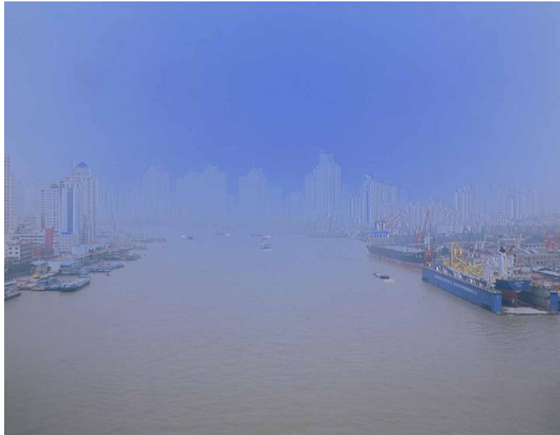
Nan pu , 2006. Ilfochrome transparency, lightbox 102 x 130 cms

The exhibition is accompanied by four large photographs on light boxes from a series of images photographed from the centres of bridges looking down the Yangtze in Shanghai and Chonching. Taken with a large format camera on plate film, they are made up of two exposures, one a positive image and the other a negative that has been cross-processed to produce the blue and acidic green and yellow colours characteristic of Yass' work. Because the boats are moving there is a moment between the exposures which always escapes the camera, and the boats appear to be followed by their own shadows or memories. Duration is introduced into the still image, and together with the manipulated colour and the haze of pollution hanging over the water, which seems to dissolve the river banks and buildings beyond, the images produce a shimmering, destabilising effect. The viewer finds themselves in an ambivalent position in relation to space and time, and in relation to the changes produced by the Three Gorges Dam.