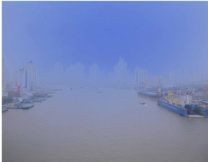
Nan pu , 2006. Ilfochrome transparency, lightbox 102 x 130 cms

“el recorrido de la cámara sobre el barco es agradable y desorientadora al mismo tiempo, tu punto de vista se desestabiliza y la imagen empieza a dominarte: esto plantea la cuestión de cómo funciona el tiempo en el espacio de una instalación y que diferencia tiene con el tiempo en una sala de cine”, dice Catherine Yass que prefiere el formato cine al vídeo además de por calidad, matices y resolución que les diferencia, por la concepción previa al rodaje: “cuando usas película de 16 mm o haces fotografías de gran formato, tienes que tomar muchas decisiones de edición antes de empezar, porque son caras y ocupan mucho sitio. Creo que para mí es mejor establecer las condiciones al principio porque eso me permite trabajar más metódicamente con el azar”.